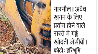
नारनौल। अवैध खनन के लिए प्रयोग होने वाले रास्ते में गड्डे खोदती जेसीबी।

■ अवैध खनन के लिए प्रयोग होने वाले रास्ते को किया बंद : सहायक खनन अभियंता