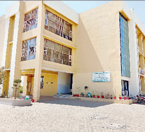
नारनौल। आयुर्वेद मेडिकल कॉलेज भवन।

उल्लेखनीय है कि गांव पटीकरा में राजकीय बाबा खेतानाथ आयुर्वेद अस्पताल