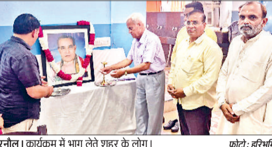
नारनौल। कार्यक्रम में भाग लेते शहर के लोग।