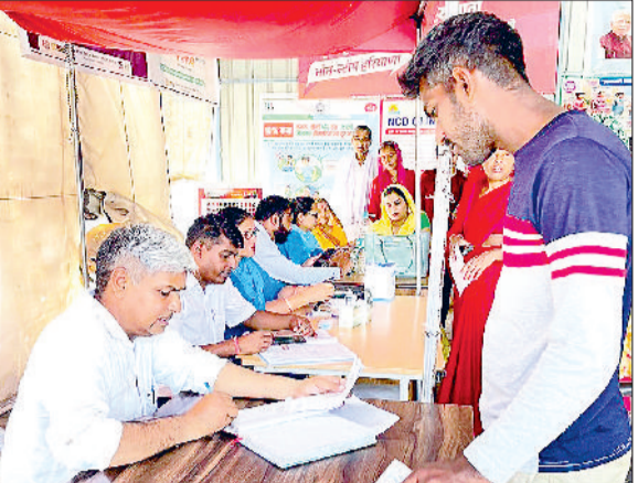
सशक्त नारी-सशक्त परिवार अभियान के अंतर्गत स्वास्थ्य जांच शिविर आयोजित