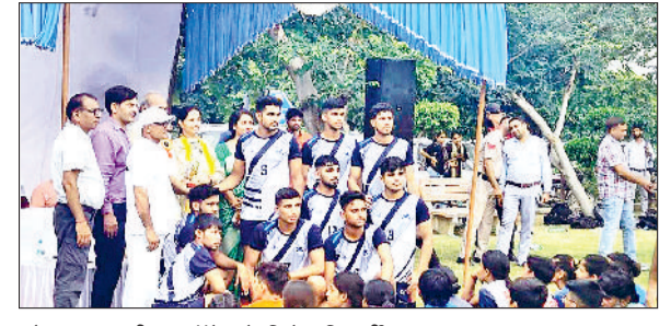
महेन्द्रगढ़। आरपीएस कॉलेज के विजेता विद्यार्थी।