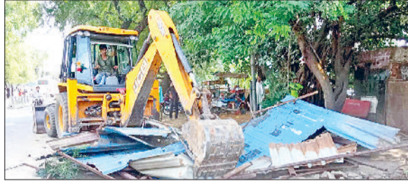
मंडी अटेली। अटेली में अतिक्रमण हटाती जेसीबी।

लंबे समय से रोड के साथ अवैध खोखों के कारण वाहन चालकों का निकलना दूधर बना हुआ था। अपनी आजीविका का साधन हटने से पहले, खोखा संचालकों ने स्वास्थ्य मंत्री को भी ज्ञापन सौंपा था, लेकिन कोई लाभ नहीं मिला। रेहड़ी संचालकों व खोखा संचालकों का कहना है कि वो सड़क पर आ गए हैं तथा बच्चों के लिए रोजी रोटी के