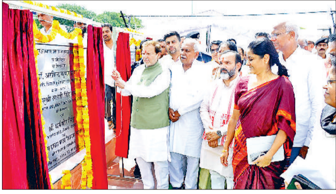
नारनौल। शिलान्यास करते विरासत एवं पर्यटन मंत्री व मरीजों से बातचीत करते पर्यटन मंत्री।