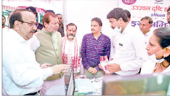
स्वस्थ नारी, सशक्त परिवार अभियान का किया शुभारंभ