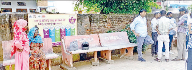
मंडी अटेली। मृतक के परिजन अटेली अस्पताल में बाहर खड़े हुए।